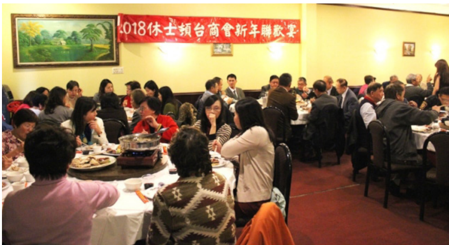
2018年新春聯歡在八達餐廳以圍爐方式舉行。

當晚計有歷任會長、理事、會員及休士頓地區各社團代表、僑界友人等近百人參與，因天氣寒冷，主辦單位準備火鍋美食，大家熱烈交流，互相交換商機，迎接新的一年，場面溫馨熱鬧。