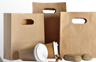
Die Cut Handle Paper Bag