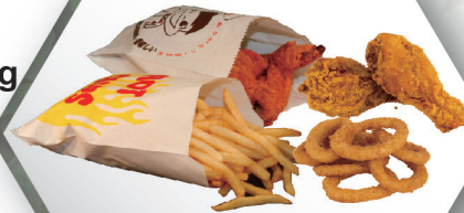
Greaseproof Paper Bag