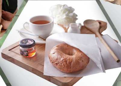
2 Side open Paper Bag