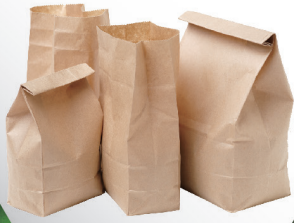
Square Bottom Paper Bag