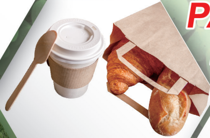
Flat Handle Paper Bag