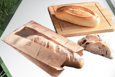
Bakery Paper Bag